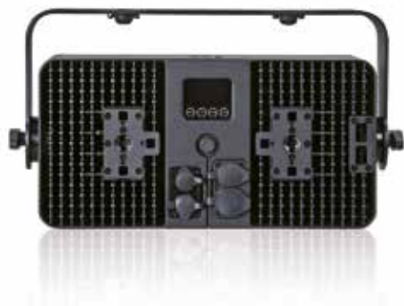
Угол луча 59°